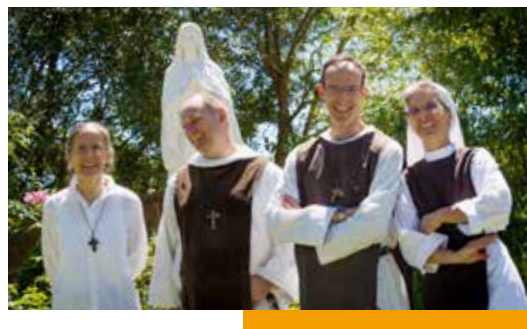
Conception : Communauté des Béatitudes